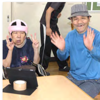
小原様・林様「楽しく踊りました!」