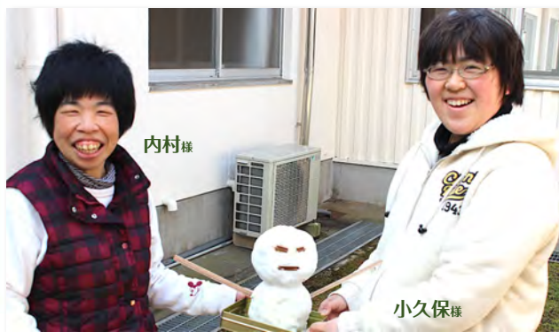
寒い中で一生懸命「雪だるま」を作りました♪(2月12日)