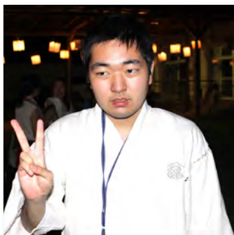
谷口様「お祭り最高!」