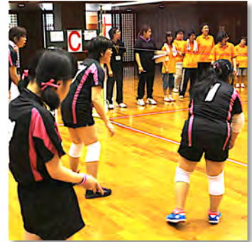
「どこにボールが来るかな?」