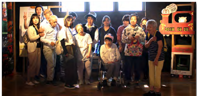
集合写真(人吉鉄道ミュージアム):施設課旅行第2班(9月25日)