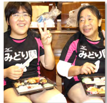
小久保様・都子様「お疲れ様でした!」