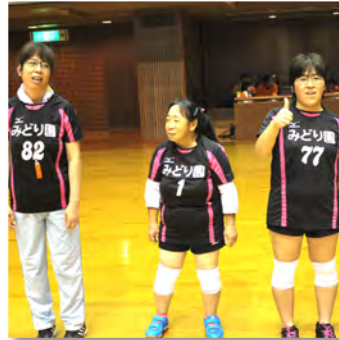
試合前の1コマ「勝つぞー!!」