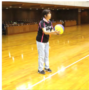
日野様「サーブ行きまーす!!」